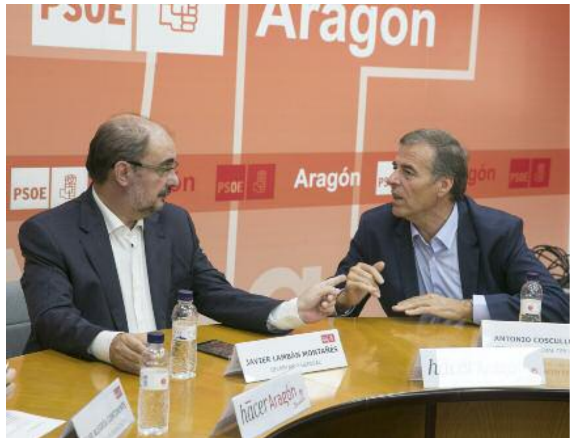
Javier Lambán y Antonio Cosculluela conversan durante el comité ejecutivo del PSOE de Aragón, ayer.

Queda descartada por tanto la opción de concurrir en coalición con Chunta Aragonesista u otra plataforma